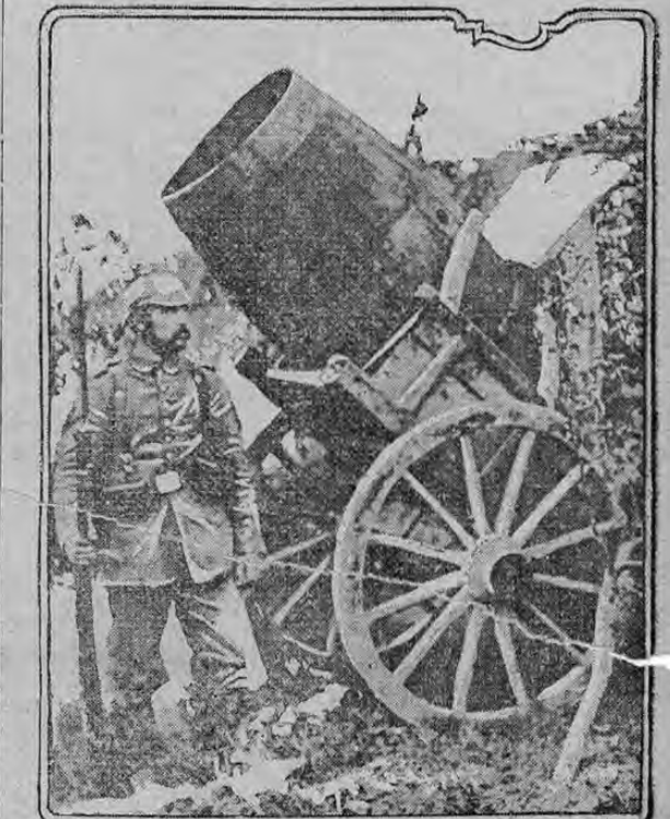
FAKE GERMAN GUN TO FOOL ALLIES

Los soldados alemanes son buenos estrategicos. Este grabado muestra un medio de que se valen los soldados alemanes para engañar al enemigo. Es la imitación de un cañón hecho de una carreta vieja y un barril vacío. Desde el aire o a cierta distancia semeja un cañón de 42 centímetros. El objeto de estos engaños es distraer el fuego de la artillería o despistar a los aviadores."